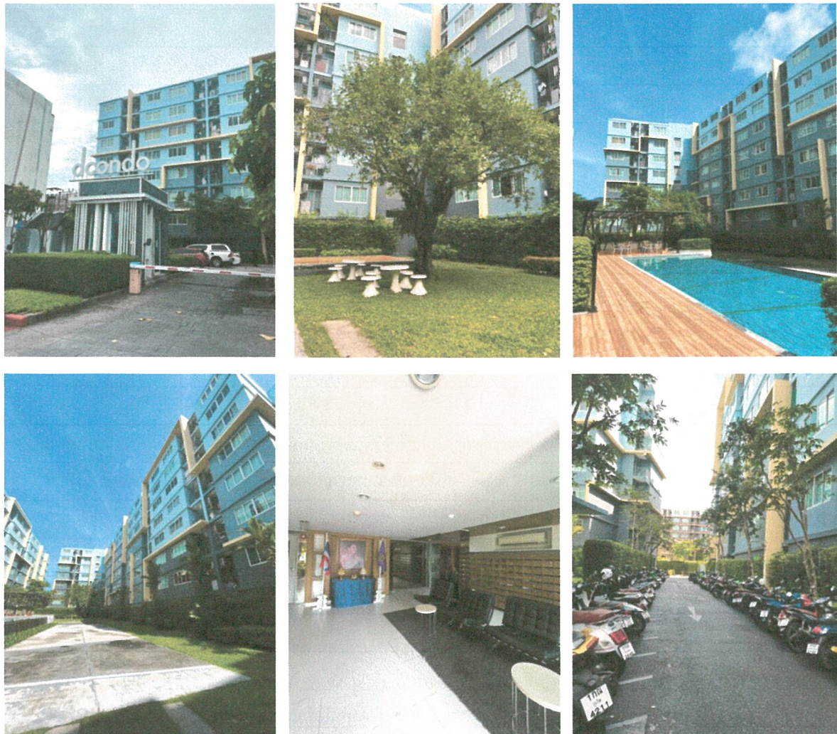
รูปที่ 1.4 การใช้พื้นที่อาคาร